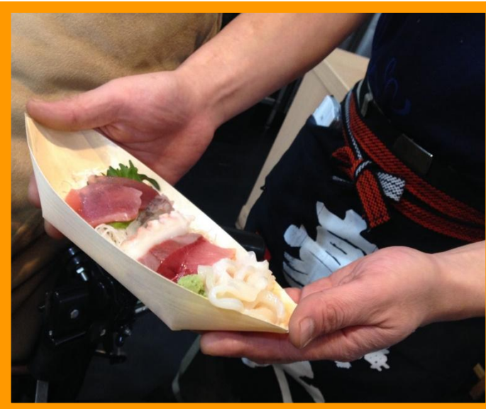
④(写真：店員さんが見せてくれた「お刺身定食」のその日のお刺身の現物)

④ランチメニューがとっても種類豊富なことが、このお店の魅力の一つです。メニューにある「お刺身定食」などは、その日のお刺身の種類が何か、気になりますよね。店員さんに質問したところ、なんとお刺身の現物を持ってきて、その場で、「本日のお刺身の種類」を説明してくれました。