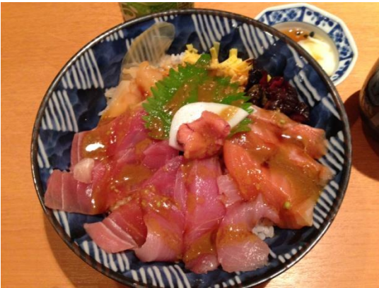
(写真：視覚に障がいをもつ方向けに工夫して出してもらった海鮮丼)

下の海鮮丼は、視覚に障がいのある方向けに、お店の人に用意してもらったものです！ 上の海鮮丼と、どこが違うかわかりますか？