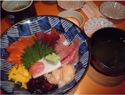
(写真：通常の海鮮丼)