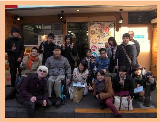
(写真：店頭で集合写真)