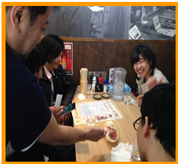
⑤(写真：店員さんが持ってきてくれたお刺身の現物を見たメンバーが、その内容について質問し、店員さんが説明してくれている様子)

④ランチメニューがとっても種類豊富なことが、このお店の魅力の一つです。メニューにある「お刺身定食」などは、その日のお刺身の種類が何か、気になりますよね。店員さんに質問したところ、なんとお刺身の現物を持ってきて、その場で、「本日のお刺身の種類」を説明してくれました。