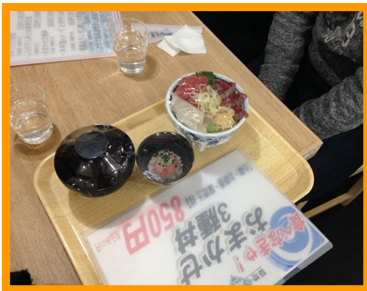
⑥(写真：店頭にあるその日のランチメニューの模型「おまかせ3種丼」には、海鮮丼、お味噌汁、小鉢がお盆にのっており、店員さんが店内のテーブル席まで運んできてくれました)

⑥視覚障がい者の方が、メニューを選ぶときに、「食べやすさがイメージできたらいいな」と店員さんに伝えたところ、店頭にあったランチメニューの模型を店内に持ってきてくれました！ランチメニューの模型を触ることで、小鉢の数や形から、食べやすさをイメージし、何をどう食べたいか考え、注文することができました。