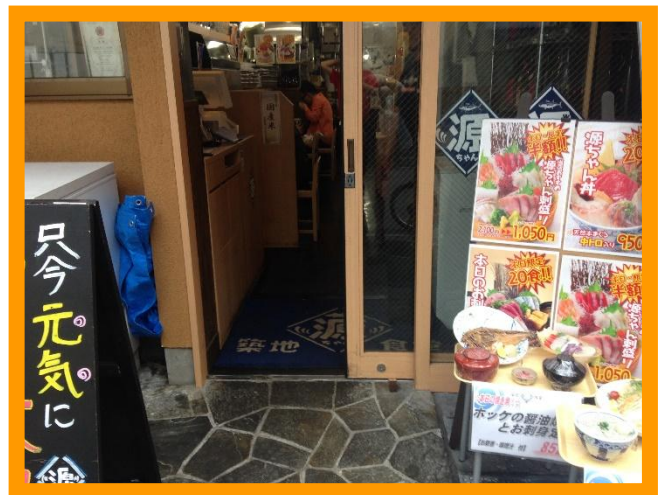
(写真：店頭の様子。入口手前右手に立っている大人の膝の高さにランチメニューの模型があります)