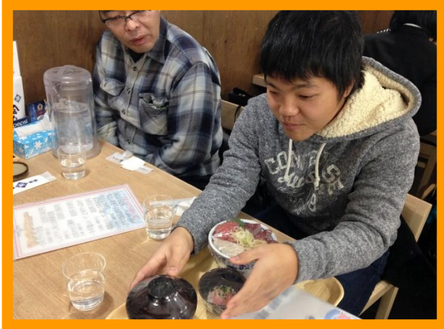
写真：店内に持ってきてもらったランチメニューの模型を、触って確認している様子