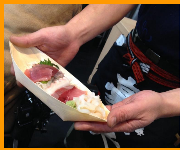
④(写真：店員さんが見せてくれた「お刺身定食」のその日のお刺身の現物)

④ランチメニューがとっても種類豊富なことが、このお店の魅力の一つです。メニューにある「お刺身定食」などは、その日のお刺身の種類が何か、気になりますよね。店員さんに質問したところ、なんとお刺身の現物を持ってきて、その場で、「本日のお刺身の種類」を説明してくれました。