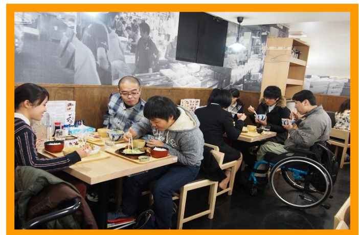
③ (写真：参加者が各グループに分かれて食事をしている様子)