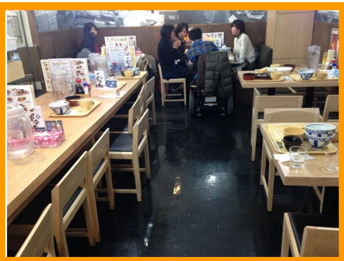
②-A(写真：中央の10人掛けのテーブル席を、左へ50cmほど移動してくれた後の店内のテーブル席の様子)

① 写真の左手には、10人掛けのテーブル席があり、その奥と手前と右手には、全部で6つの4人掛けのテーブル席があります。通常時の左手のテーブル席と、右手のテーブル席の幅は、1m程度で、車椅子が1台入ったら、角度を変えることが少し難しい幅だったので、店員さんに相談したところ、今回は車椅子の参加者の方が多かったこともあり、店員さんが次のような提案をしてくれました。