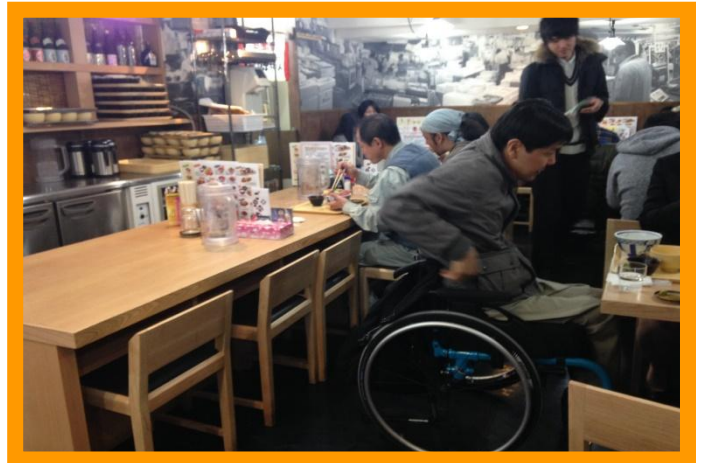
②-B(写真：中央の10人掛けテーブル席移動後に、車椅子の方がお誕生日席に着いている様子)

② -A,B な…なんと、写真のとおり、店員さんが車椅子の方の出入りと食事がしやすいように、中央の10人掛けのテーブル席を左に50cmほど移動してくれました！！ 車椅子の方が席に着いた通路とは反対側の、中央の10人掛けのテーブル席を挟んで、左隣のカウンター席の通路は、人がひとり通れる幅を確保して、移動してくれました。