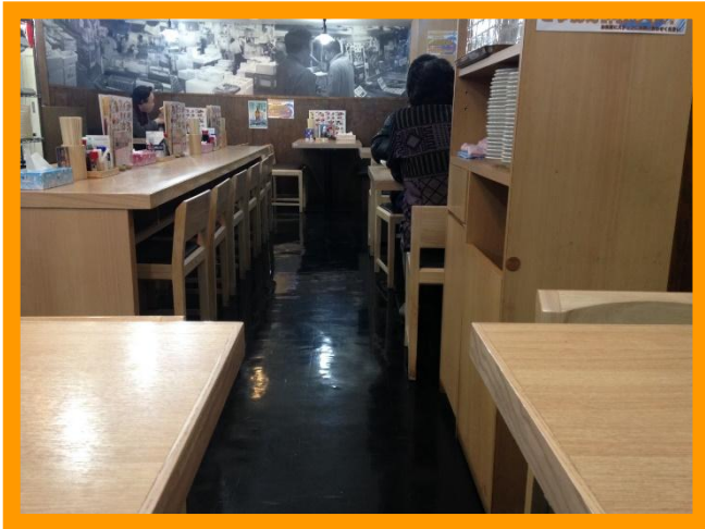
① (写真：通常時の店内テーブル席の様子)

① 写真の左手には、10人掛けのテーブル席があり、その奥と手前と右手には、全部で6つの4人掛けのテーブル席があります。通常時の左手のテーブル席と、右手のテーブル席の幅は、1m程度で、車椅子が1台入ったら、角度を変えることが少し難しい幅だったので、店員さんに相談したところ、今回は車椅子の参加者の方が多かったこともあり、店員さんが次のような提案をしてくれました。