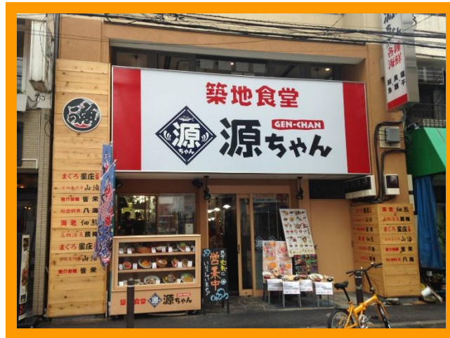
写真：お店正面の外観